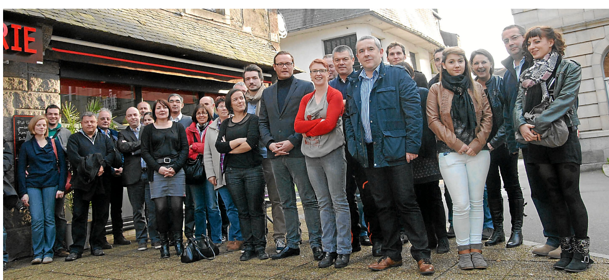
Partenaires et mécènes étaient réunis pour découvrir quelques nouveautés de l'édition 2013 des Charrues.

Les Vieilles Charrues veulent entretenir la flamme du mécénat et des partenariats. Ces entreprises locales, départementales, régionales représentent 20% du budget du festival. Plusieurs patrons d'entreprises, partenaires des Vieilles Charrues, étaient présents ce samedi 23 mars pour être informés des quelques nouveautés de l'édition prochaine. L'espace VIP va changer de structure, le village partenaires va être réorganisé, le système monétique pour l'espace VIP pourrait être le cashless avec une carte prépayée. Egalement en projet : une boutique merchandising avec une gamme différente. Des entreprises chouchoutées dans un