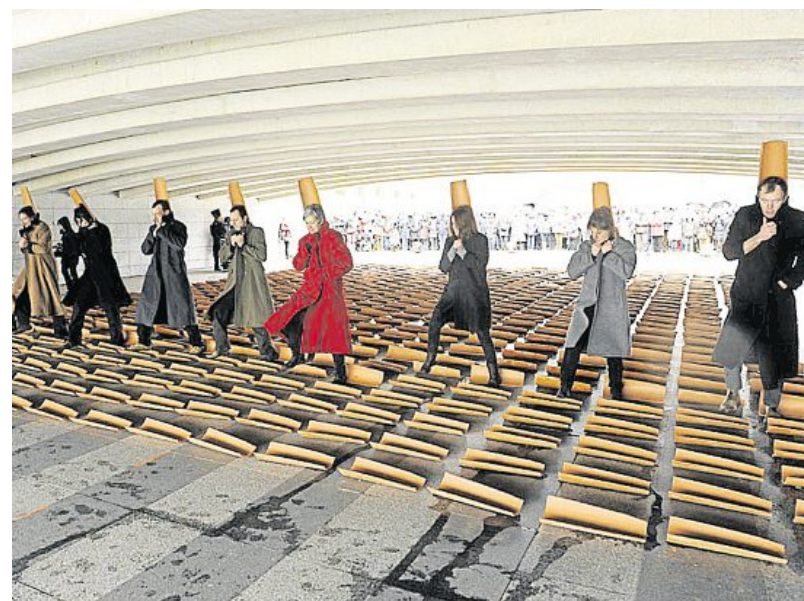
On salue les artistes du collectif G. Bistaki, qui, pour la venue de la ministre, ont présenté leur spectacle « Cooperatzia, Le Chemin », où se mêlent cirque, théâtre, danse et installation plastique, par un temps glacial place de la Liberté.