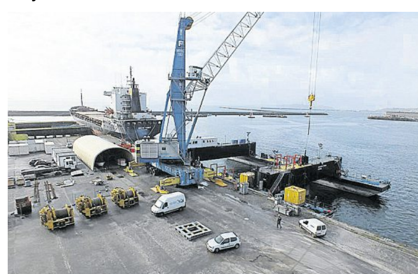
Au 5 e bassin, à bord de la barge Openhydro Triskelel, l'activité est intense.

Au 5 e bassin Est, les techniciens de plusieurs sociétés sont affairés à bord de la barge Openhydro Triskell . Les équipements embarqués ont été modifiés, notamment les trois treuils permettant de monter ou descendre l'hydrolienne Arcouest.