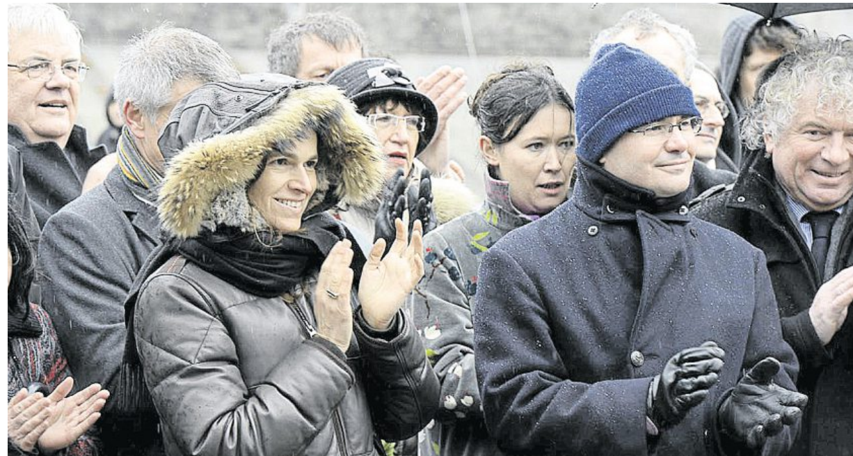
Aurélie Filippetti, ministre de la Culture et de la Communication, à son arrivée place de la Liberté, où elle découvre le spectacle « Cooperatzia, Le Chemin », du collectif G. Bistaki.