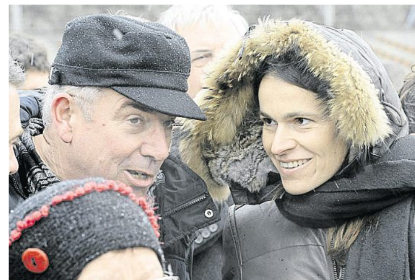
Aurélie Filippetti, avec Claude Morizur, co-directeur du Fourneau. Qui s'est fait l'interprète du réseau des 10 Centres nationaux des arts de la rue, « un réseau totalement engagé et légitime pour devenir la colonne vertébrale du Conseil national des arts et de la culture dans l'espace public (Cnacep) », souhaité par la ministre.