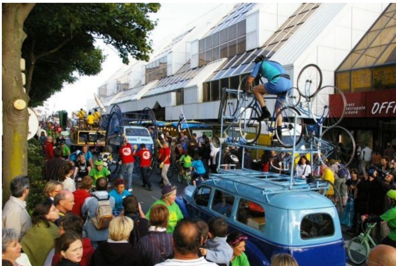
« Jamais 203 » par Générrik Vapeur, présentation des équipes du Tour de France (3 juillet 2008)