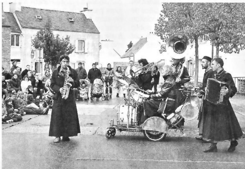
La fanfare Sergent Pépère a un peu réchauffé le printemps des arts de la rue, dont la première étape 2010 a eu lieu dimanche à Kersaint.

Tout au long de la journée, interventions impromptues de la Brigade des abers du théâtre des Tarabates et toujours dégustation de fruits et de légumes par l'entreprise Le Saint.