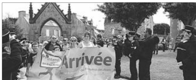
L'arrivée des randonneurs, sous la haute surveillance de la fameuse Brigade des Abers.