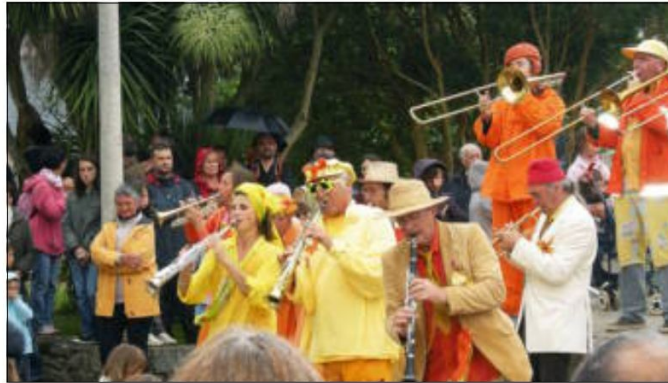
Ça chauffait avec la Fanfare Zébaliz !

Spontanément, des spectateurs se sont précipités avec leur parapluie, pour protéger les musiciens. Les cuivres ont rutilé, suivis par la dynamique prestation des élèves du collège Saint-Antoine, avec leur capoeira. Et les Danserien Aberiou ont suscité de chaleureux applaudissements.