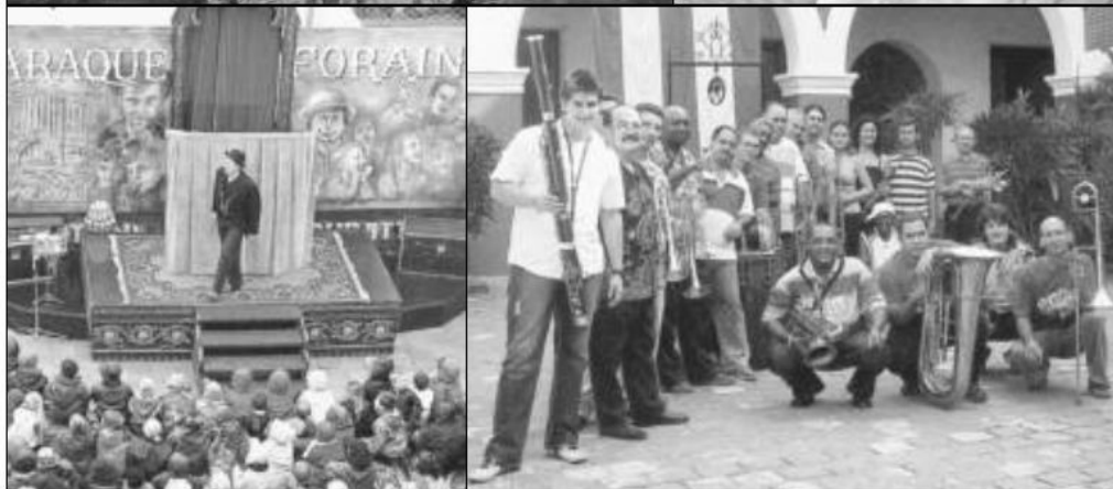
À partir du 2 mai, les spectateurs seront invités à découvrir la fanfare rennaise Sergent Pépère (en haut, à gauche), le cirque de rue de la compagnie irlandaise Tumble Circus (en haut, à droite), le théâtre forain de l'illustre famille Burattini (en bas, à gauche) et la Banda d'Holguin, venue de Cuba

Le Printemps des arts de la rue au pays des Abers propose quatre rendez-vous, du 2 mai au 13 juin, du cirque de rue et du théâtre forain.