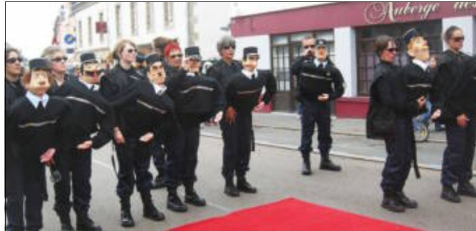
Lors des averses, la Brigade des Abers veillait au grain !

Le Télégramme – Lannilis – 1 er juin 2010