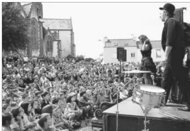
La foule massée autour du théâtre de l'illustre famille Burattini.

Une excellente ambiance, un temps idéal et, de mémoire de Plouguinois, on n'avait pas vu un tel public. Après le spectacle de